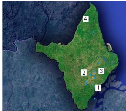
Figura 1: Distribuição espacial das estações. (1) Macapá (2) Serra do Navio (3) Pacuí (4) Oiapoque.

long. 50,86°; alt. 17 m. Adicionalmente as PCDs do tipo meteorológicas estão instaladas nos Municípios de Serra do Navio e Oiapoque, com coordenadas geográficas respectivamente, lat. 090°; long. 52,00°; alt. 91m e lat. 3,81° long. 51,86°; alt. 152m.